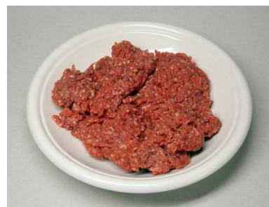
Obrázek č. 7